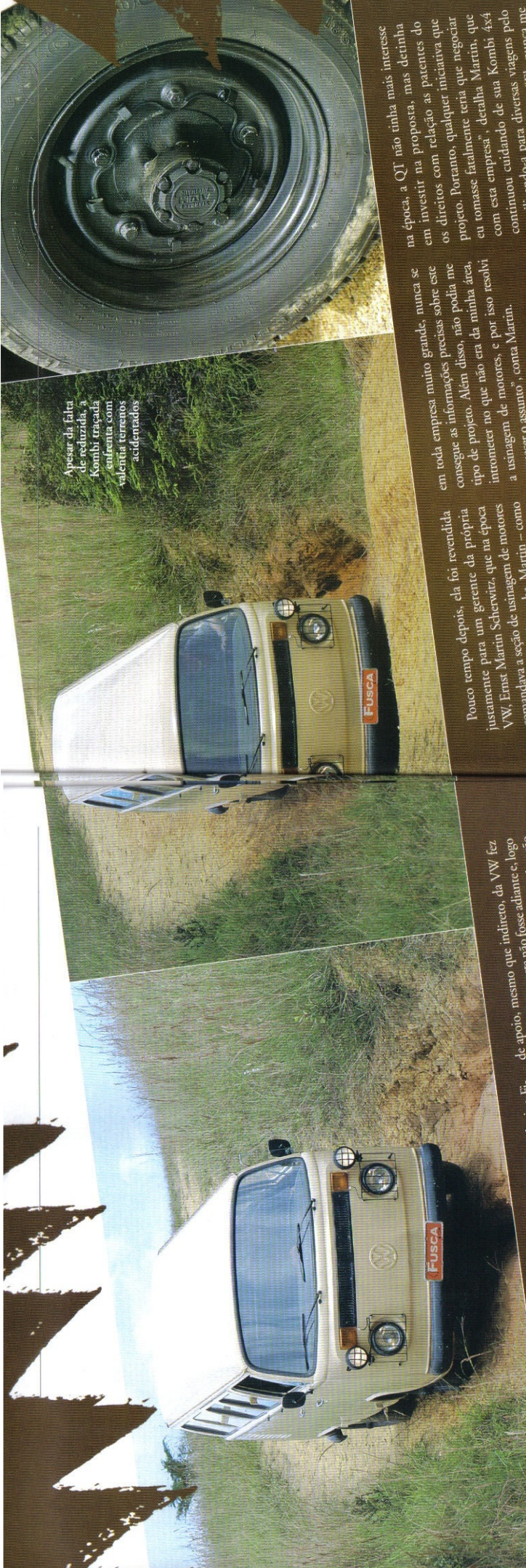
Apesar da falta de reduzida, a Kombi traçada enfrenta terrenos acidentados

Ao investir no projeto de tração 4x4 para a Kombi, a Dacunha focava num enorme mercado potencial e, para isto, baseou-se no grande sucesso comercial do utilitário da Volkswagen no interior do Brasil, onde a maior parte das estradas vicinais não eram pavimentadas. Por sinal, a maioria ainda não é. Isso foi no fim da década de 1970, quando o empresário Hélio da Cunha encomendou o projeto à empresa QI (de "qualquer terreno" - Engenharia e Equipamentos - a mesma que havia desenvolvido sistema semelhante para utilitário Jég também fabricado pela Dacunha (ver edição 5 de Fusca & Cia.).