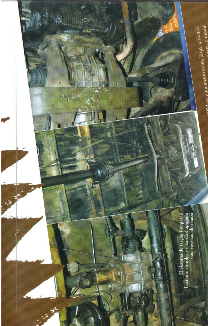
O sistema de tração integral é bastante simples e o cardã é apoiado nas travessas do chassi