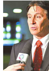
Senador do PMDB-CE: expectativa

O presidente do Senado, José Sarney (PMDB-AP), pode abrir mão de disputar a reeleição. Hoje, a oposição não lhe oferece resistência e a presidente eleita Dilma Rousseff já deixou claro seu agrado diante da perspectiva de um segundo mandato. O problema é que o senador de 80 anos apresenta um quadro de arritmia cardíaca e revela cansaço. A alternativa com a qual os governistas trabalham pode gerar um fato inédito no Senado, de um recém eleito estrejar na Casa sentado na