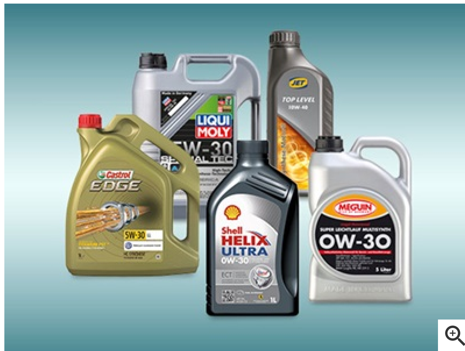
Bekannte Öle: Castrol, Liqui-Moly, Shell, Jet und Meguin

Longlife-Öl hat besondere Additive. Sie sorgen dafür, dass Ablagerungen im Motor möglichst vermieden oder beseitigt werden. Sie sind in der Regel nach SAE 0 W oder SAE 5 W klassifiziert und eher dünnflüssig. Damit sie die Motorteile trotz ihrer Dünnflüssigkeit gut schmieren können, werden sie mit speziellen Zusätzen optimiert.