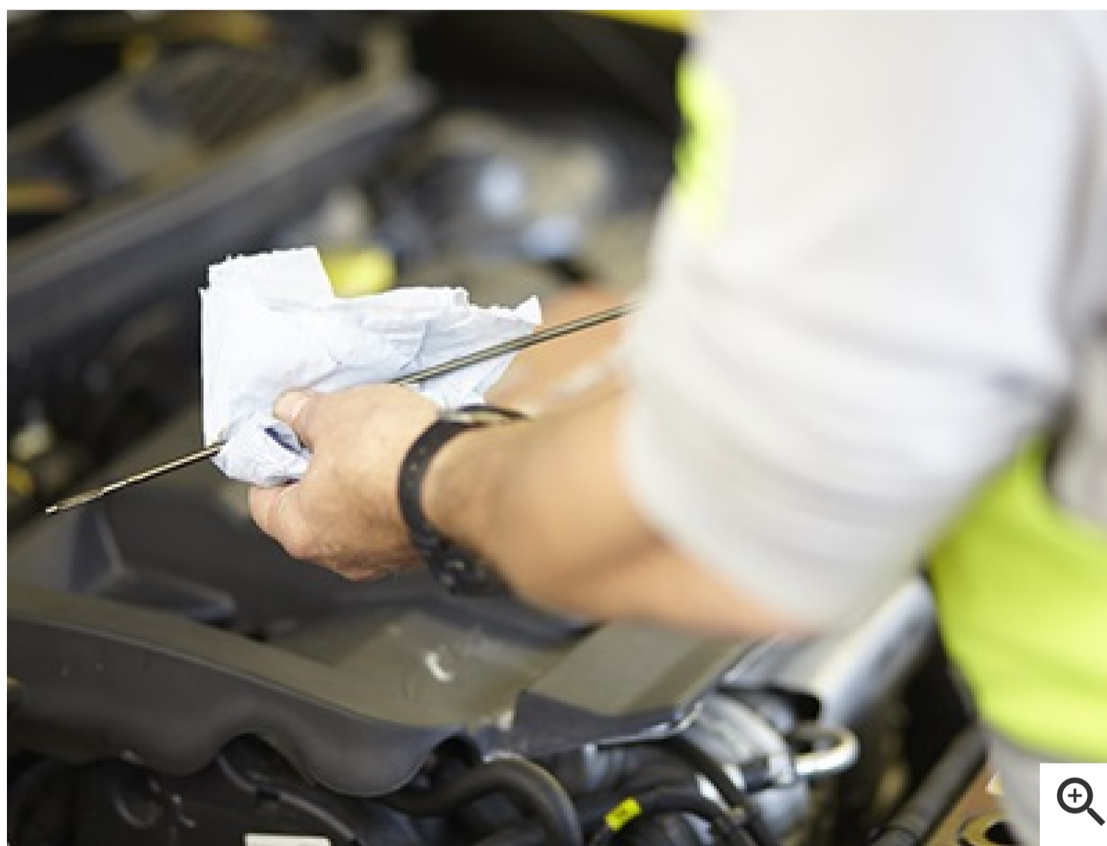
Vor dem Messen: Unbedingt den Ölstab abwischen

Ein falscher Ölstand kann Motorschäden verursachen. Deshalb sollte er regelmäßig bei warmem Motor überprüft werden. Warten Sie nach dem Abstellen des Motors etwa zwei Minuten. In dieser Zeit ist das Öl aus dem Motor in die Ölwanne gelaufen. Ziehen Sie erst dann den Ölmesstab heraus, säubern Sie ihn mit einem Tuch und führen ihn dann wieder bis zum Anschlag ein.