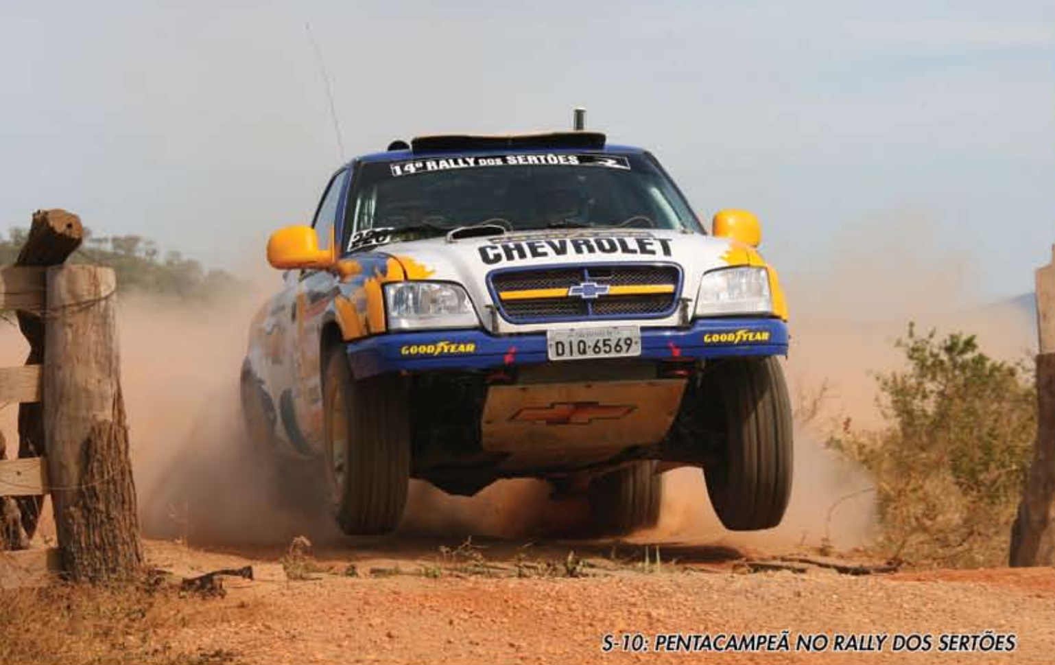
S-10: PENTACAMPEÃ NO RALLY DOS SERTÕES