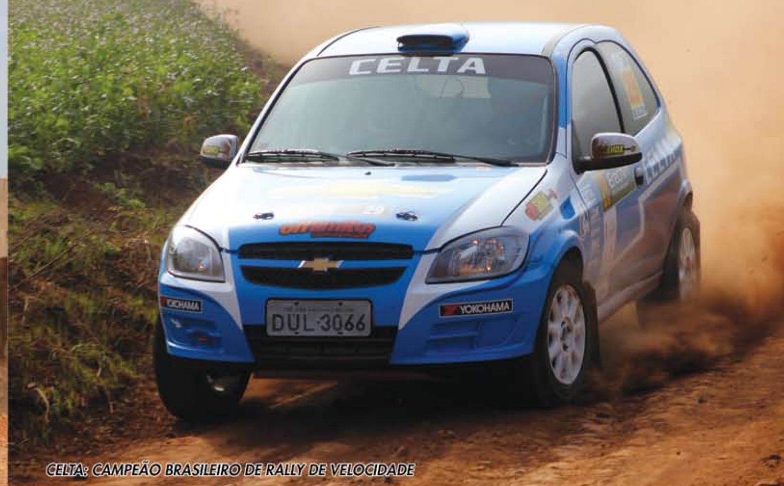
CELTA: CAMPEÃO BRASILEIRO DE RALLY DE VELOCIDADE