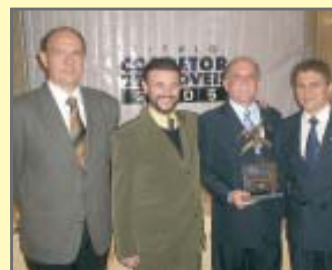
Entrega do Título de Corretor do Ano 2005/2006