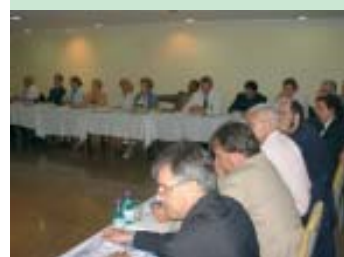
Corretores de imóveis e diretoria do Creci-PR e Sincil-Londrina