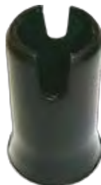
Guarda Pó do bico Cummins