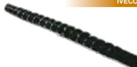
550/614 Iveco Espiral Preta 28 x 1400 mm 7.145.944