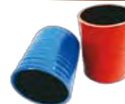
550/318 Intercooler VW 8120/8140/8150 - Vermelha - 76 x 100 mm 2TA.117.247