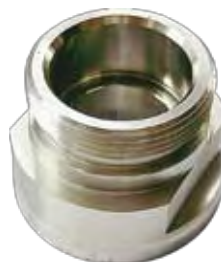
Base Solenoide VOLVO FH12