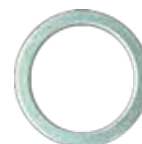
Arruela de Alumínio 14,2 x 18,0 x 1,0