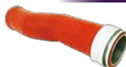
550/655 Intercooler NL10/NL12 Inf - Bocal e Luva Alumínio - Vermelha 70 x 420 mm 1.676.218