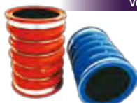
550/657 - Vermelha 550/658 - Azul Intercooler/Superior NH/FH/FM - 6 Anéis 83 x 140 mm 20.463.924 / 1.676.481