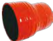
550/423 Intercooler Ligação VW 24220/35300 CUMMINS - Vermelha - 85 x 63 x 100 mm TRG.117.231A