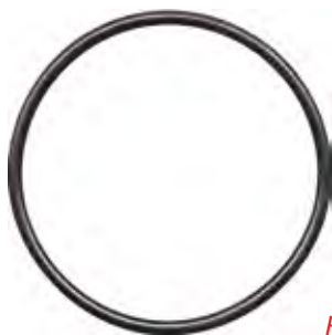
Anel do Mancal da Bomba 7100/7200