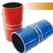
550/611 - Vermelha 550/612 - Azul Intercooler Iveco Eurotech - 2 Anéis 90 x 180 mm 41.026.109