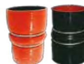
550/416 - Vermelha 550/417 - Preta Intercooler Ligação Conica VW 24250/35300 - 2 Anéis TRG.117.233