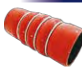
550/203 - Vermelha 550/204 - Preta Intercooler MBB 914 LO 814 SAIDA - 4 Anéis - 70 x 170 mm 668.528.21.82