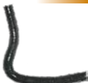
550/617 - Vermelha 550/618 - Preta Iveco