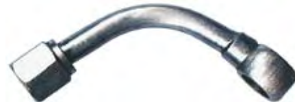
Tubo Adaptador da Bomba Alimentadora F-4000