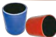
550/409 - Vermelha 550/410 - Azul Intercooler Lisa VW Motor B Lateral 63 x 70 mm TRA.145.467