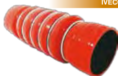
550/205 Iveco Cavallino 6 Anéis - Vermelha 70 x 240 mm