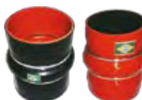
550/109 VW 2 Anéis - Vermelha - 76 x 110 mm TQG.117.231