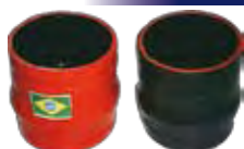
550/200 - Vermelha 550/201 - Preta Mang. Turbina Luva c/1 voluta - 62 x 85 mm 352.997.19.82