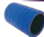
550/651 Intercooler B58 / B10 M - Azul 33 x 70 mm 469.951