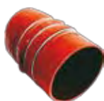
550/426 Entrada VW BUS 17240 O T Inferior - 3 Anéis - Vermelha - 101 x 150 mm 2ZO.145.828