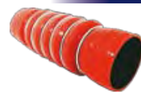
550/205 - Vermelha 550/206 - Preta Intercooler MBB 914 LO 814 Entrada - 6 Anéis - 70 x 240 mm 670.528.05.82