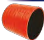
550/202 LS 1935/1941 Vermelha - 70 x 70 mm 427.997.01.83