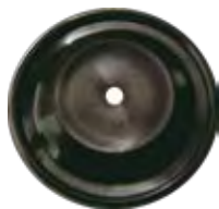
Membrana do Limitador de Fumaça Bomba VE