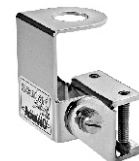
M-550 Suporte Calha Cromado