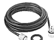
M-801k Kit Curto Rg-58 - 3,5 m Cabo M-802k Kit Médio Rg-58 - 5,5 m Cabo M-803k Kit Longo Rg-58 - 7,5 m Cabo