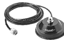
M-700K Suporte Magnético 4,0 m Cabo