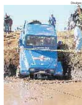
No poço de lama, o piloto encontra buracos, pedras e troncos