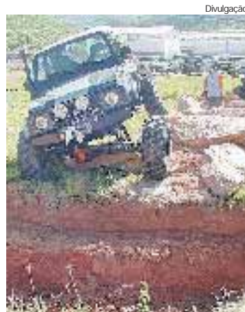
Uma das etapas da prova é composta de rochas e exige muita técnica