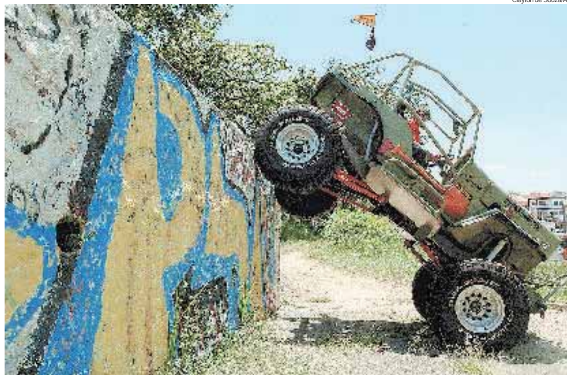
Jeep Willys 1954 preparado para a categoria super: descida de paredões com mais de 2 metros de altura

As inscrições para o evento, que ocorrerá entre 3 e 5 de dezembro no Auto Shopping Global (Avenida dos Estados, 8000, em Santo André), podem ser feitas no site www.ubroc.com.br . Para participar deve-se levar uma cesta básica.